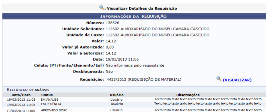
Figura 3 - Protótipo para tela de visualização de histórico de análises